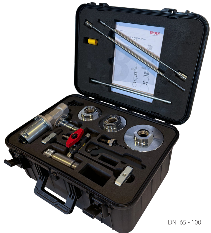
DN 65 - 100