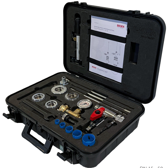
DN 15 - 50